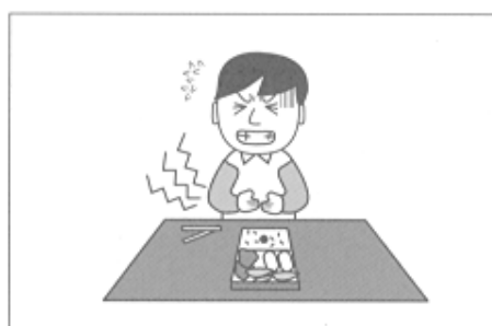
(3) 活動中、食べた弁当でボランティア自身が食中毒になった。

②賠償事故……ボランティアがボランティア活動中の偶然な事故により他人にケガをさせたり、他人の物を壊したことにより法律上の賠償責任を負った場合に保険金をお支払いします。