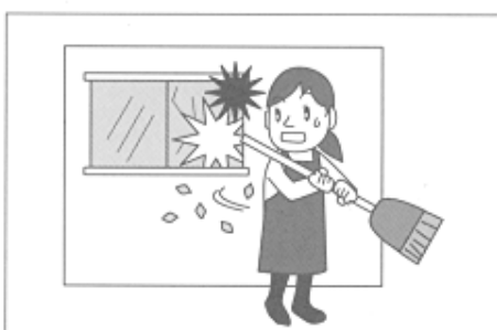
(2) 家事援助ボランティア活動で清掃中、誤ってガラスを割った。