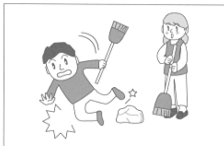
(1) ボランティア活動中に、転んでケガをした。

①傷害事故……ボランティアがボランティア活動中の急激・偶然・外来の事故によりケガをした場合に保険金をお支払いします。