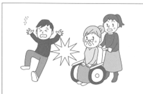
(1) ボランティア活動中、誤って他人にケガをさせた。

②賠償事故……ボランティアがボランティア活動中の偶然な事故により他人にケガをさせたり、他人の物を壊したことにより法律上の賠償責任を負った場合に保険金をお支払いします。