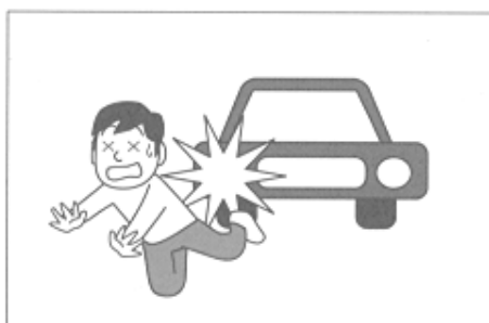
(2) ボランティア活動に向かう途中、交通事故にあった。