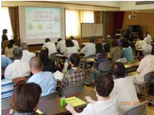
地域福祉活動勉強会の様子