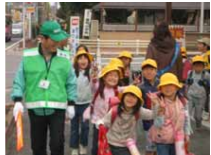
活動の原動力は子どもたちの笑顔？

審者が出没したことをきっかけに、町内の有志で自発的にパトロールを始めたことから「城南町スクールパトロール隊」に発展し、今では町内の高齢者が多数参加して、小学生との自然な交流も生まれています。今回の受賞は参加されているみなさんの大きな励みとなりました。