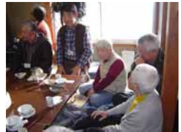
みまもり会メンバーとご近所の高齢者で楽しいひと時を！

12月には、福祉委員会のメンバーである、昨年8月に発足した町内のボランティアグループ「みまもり会」のメンバーによる「ふれあいの会」が開催され、近所のお年寄りが集まって、楽しいひと時を過ごしました。今後は毎週木曜日の午後にサロンを開催し、近隣住民のふれあいの場づくりに取り組んでいく予定だそうです。