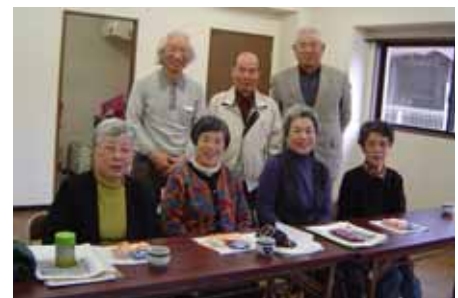
「かがやき」の会のみなさん いつでも新会員募集中だそうです！

花ノ木町の中でひととき高くそびえ立つ「グローリアスハイツ安城」。 平成元年に入居が始まったこのマンションで、 人と人とのつながりを持ちたいと、ひとり暮らしの高齢者や高齢者世帯の有志が集まって、月1回の集まりを持っています。 今までに介護保険や福祉サービスなどについての勉強会をしたり、新しくできた福祉センターの見学をしたり、緊急時の連絡方法などについても話し合ってきました。常時8人のメンバーが集まり、最近では映画会を開いたり、デンパークに出かけたりと楽しい行事も増えて、お互いの親睦を深める中で、困りごともし合えるようになってきたそうです。