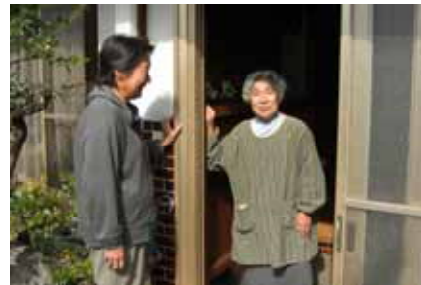
まごころ福祉サポート隊のメンバーがご近所を訪問

このような取組みを進めることにより、認知症高齢者など新たな要援護者の掘り起こしも進んできました。