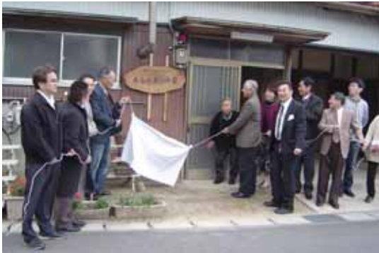
南ふれあいの家の開所式

市内でも世帯数が多く、今も人口が増え続けている横山町。若い世代も多く、活力ある町内ですが、町内の規模が大きすぎてきめ細やかな活動が難しいことが悩みの種でした。