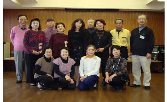
うきうき社交ダンスみなさん

あなたもあたたかいメンバーに囲まれ、和やかな雰囲気の中で幸せなひと時を一緒に過ごしませんか？