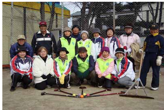
石橋グランドゴルフクラブみなさん

また、グランドゴルフ以外にも、平成 20 年からペットボトルのキャップを集めて世界の子どもたちにワクチンを届ける『エコキャップ「集めてワクチン一人分」運動』へ参加しています。定期的に地域のコンビニへも回収に出かけます。 北部福祉センターにも回収箱を設置しましたので、ぜひご協力をお願いします！