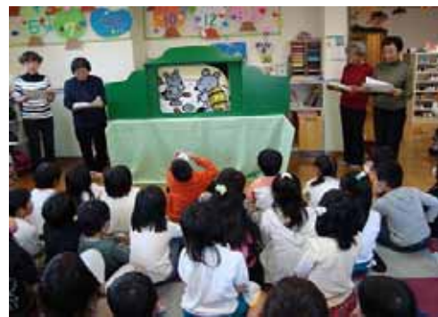
児童クラブを訪問

活動が始まって 25 年あまり。忙しくて参加できない時期があっても、それをみんなが理解してくれるので長く続けて来れました。現在 8 名で活動しています。 新規メンバー募集中 です。興味がある方はぜひ一度見学に来てください！ 読み聞かせの依頼もお待ちしています。