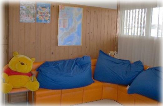
▲人気のくつろぎスペース