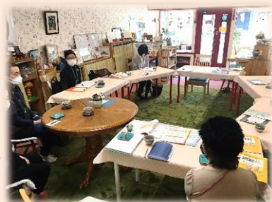
▲ 普段の生活や趣味の話に華が咲きます。

※認知症の診断はされてなくても、物忘れなど不安を感じている方も参加できます。参加者のプライバシーは守られます。