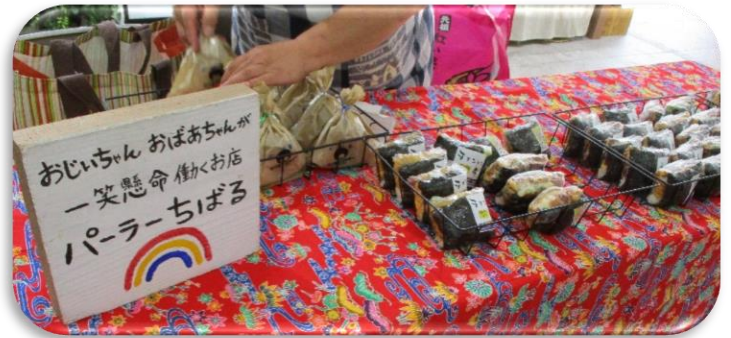
▲認知症の方が元気にはたらく「ちばる食堂」によるおにぎり等の販売コーナー