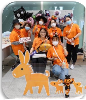
▲認知症初期集中支援チームによる「フォトスポットコーナー」