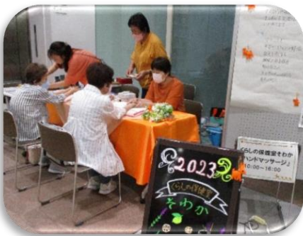
▲くらしの保健室そわかさんによる「ハンドマッサージ」気持ちがほぐれます♪