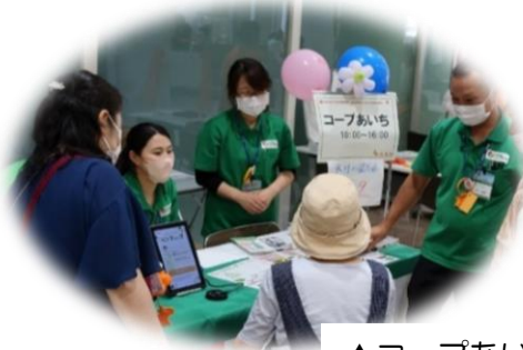
▲コープあいちさん