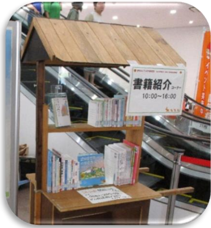
▲認知症に関する「書籍紹介コーナー」