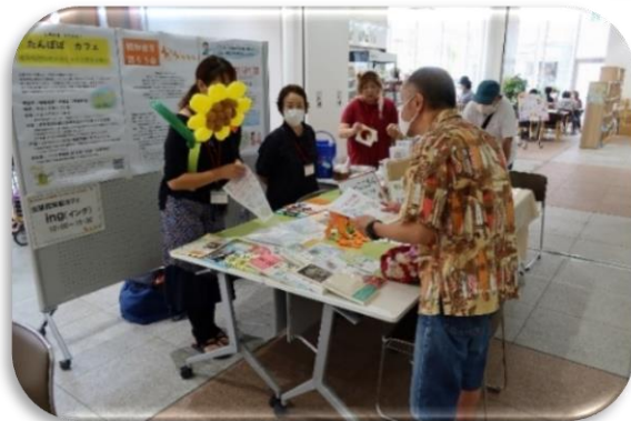
出張認知症カフェ ◀ingさん