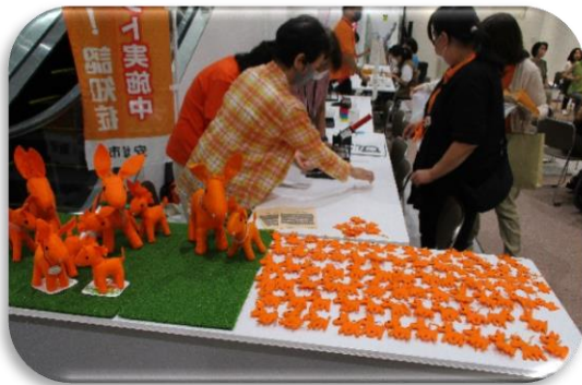
▲チームオレンジさんによる「缶バッチづくり」コーナー&安城老健の利用者さん手作りの口バ。啓発のために配布しました。