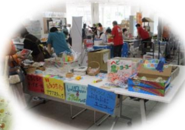
▲ぬくもりワークス

中央地区社協では、認知症になっても、周りの方の支えでその人らしく生きていくことができる、安心して暮らしていける地域づくりを目指しています。