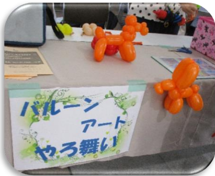
▲「やろ舞い」さんによる バルーンアート

9月2日（土）と9月21日（木）、アンフォーレにおいて認知症啓発イベントを開催しました。ボランティアの方をはじめとして、多くの方の協力により、延べ2,000名以上もの方にご参加いただきました。