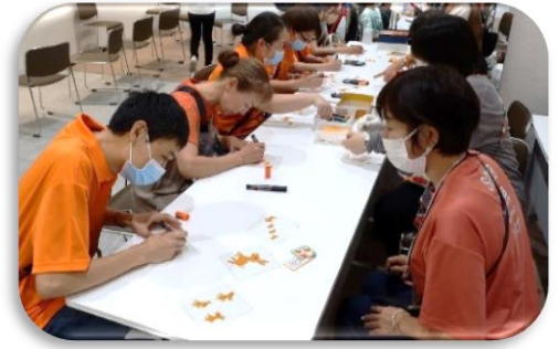
▼チームオレンジさんによる「プラ版づくり」コーナー