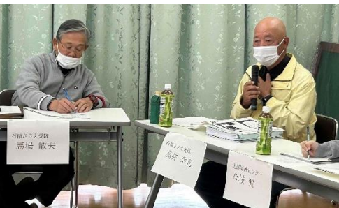
▲石橋ささえ愛隊の活動の様子