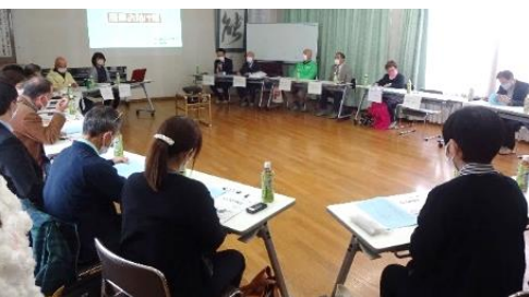
▲情報交換会の様子