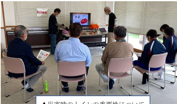
▲災害時のトイレの重要性について