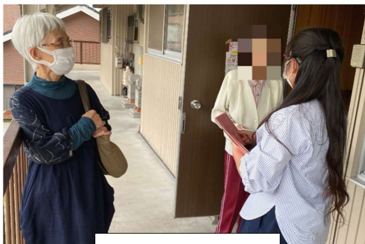
作業終了後にちょっとお話…

包括支援センター中部が自宅に訪問した際に、溜まっている新聞紙の束を見つけ、「捨てないのか」と確認したところ、「足が痛くて階段を下りて捨てに行けない」という話があり、お互いさまの会での支援に繋がった。