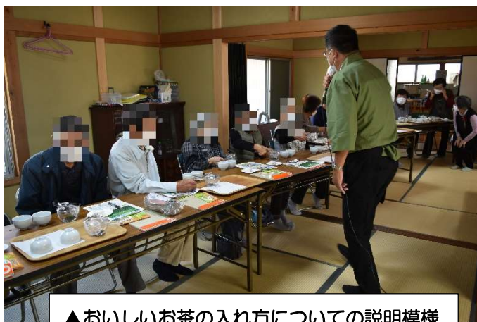
▲おいしいお茶の入れ方についての説明模様

セミナーでは、講師がお茶を入れる道具一式を用意してくださり、お茶の歴史、種類、おいしい入れ方を教えてくださいました。