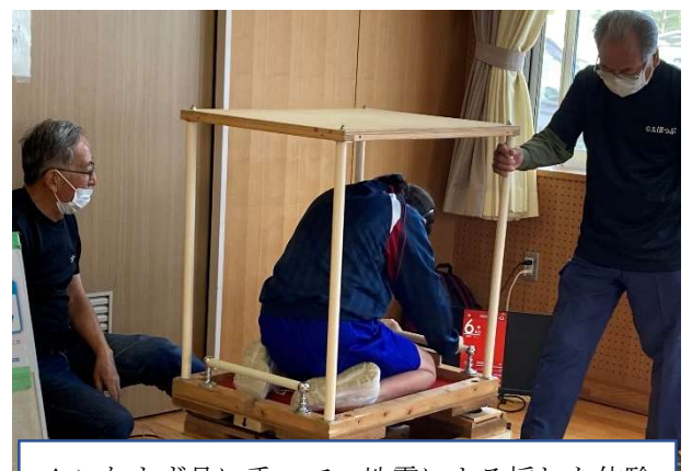
▲こなまず号に乗って、地震による揺れを体験

講話の中では、東日本大震災の発生直後の映像が紹介されました。震災当時の記憶があまりない中学生たちは、真剣な表情で説明を聞いていました。実際の映像を見ることで、震災の恐ろしさを知り、地域でどんな事が起こりうるのか、中学生の自分たちに何ができるのかを考えるきっかけになりました。