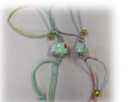
▲来年の干支はうさぎです