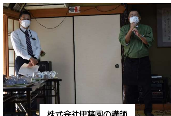
株式会社伊藤園の講師

早速、西別所町福祉委員会を交えて打ち合わせを行い、11月2日（水）の「しいの木サロン」にて、おいしいお茶の入れ方セミナーを開催しました。