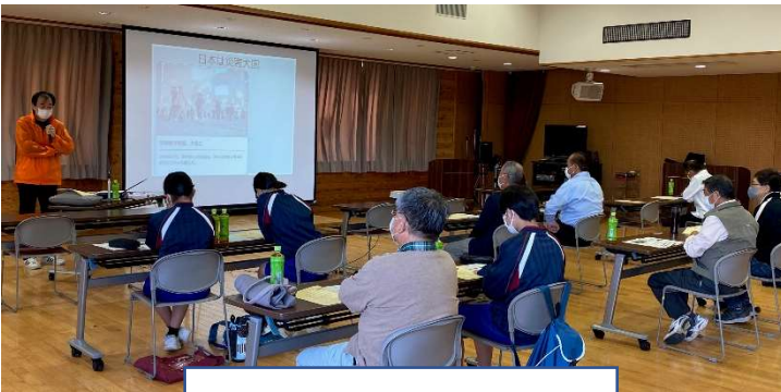
▲日本で起きた災害について

また、地域の自主防災組織の方と交流することもでき、自分たちの住んでいる地域の防災はどのように進められているのかを知る機会にもなりました。