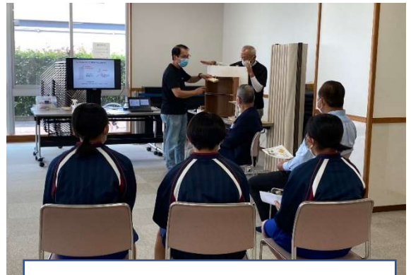
▲棚を使っての家具の転倒防止について