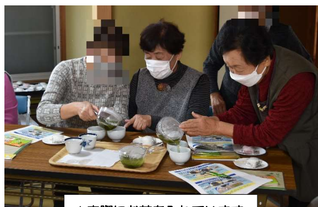
▲実際にお茶を入れています

その後は、いよいよお茶の入れ方の実践です。教えていただいた一つ一つの工程を丁寧に行い、自分でお茶を入れています。