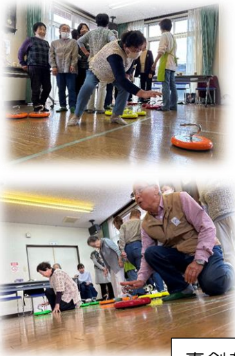
真剣な表情で滑らせる参加者