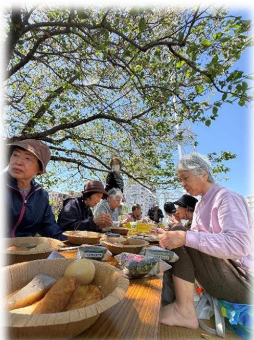
春のおでんを楽しみました