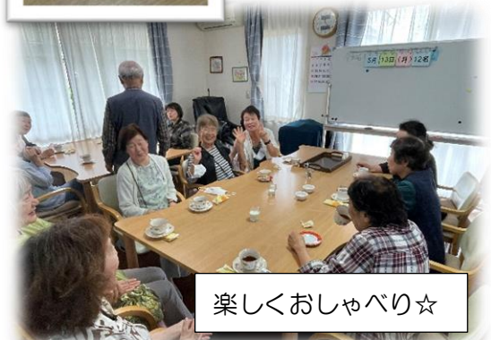
楽しくおしゃべり☆