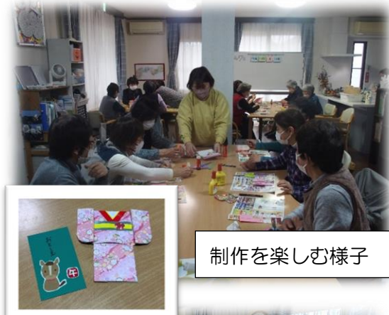
制作を楽しむ様子