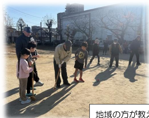
地域の方が教えている様子

当日は、地域の方が子どもにゴルフクラブの持ち方や打ち方を教えている姿があちこちに見受けられゴルフを楽しみました！なかなか3世代そろって交流する機会がないため、お互いにとって貴重なひと時でした♪