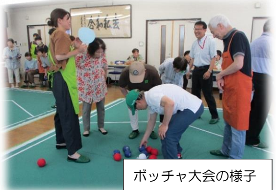
ボッチャ大会の様子