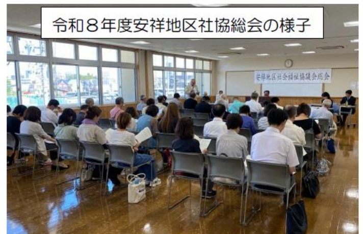
令和8年度安祥地区社協総会の様子