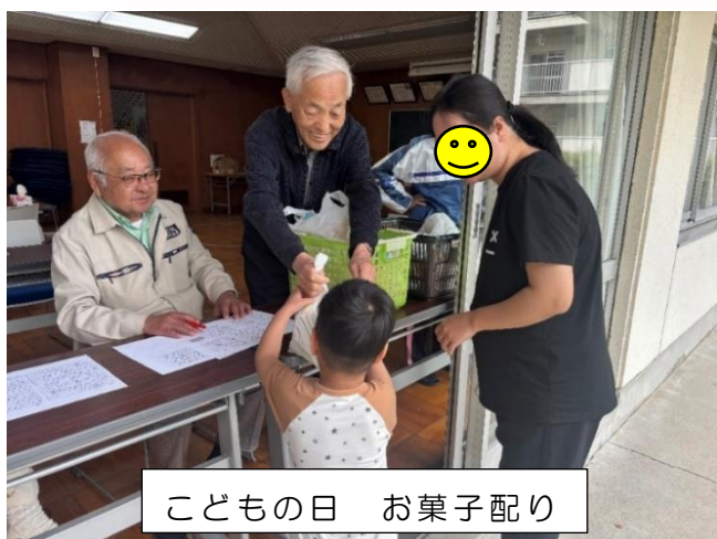
こどもの日 お菓子配り

古井住宅にお住まいの小学生以下のお子さんを対象に、町内会からお菓子が振る舞われました。