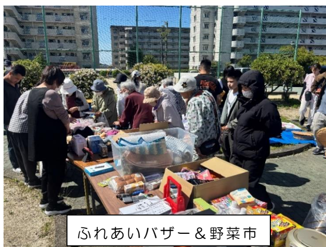
ふれあいバザー&野菜市

住民から寄付された食器や雑貨、洋服などの不用品や、退去時にいらなくなった家具や家電などを集め、必要な人に無料で譲渡するふれあいバザーが、生活支援隊により行われています。また、バザー会場の横では、新鮮な野菜が破格の安さで購入できる野菜市も行われており、バザーと合わせ、多くの住民でにぎわっていました。