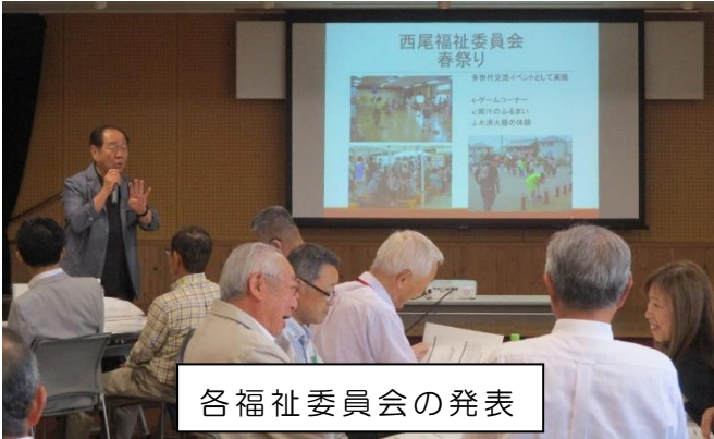
各福祉委員会の発表