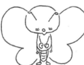
安城市社協キャラクター ハートン

西部地区社協だより「せいぶ」では、西中学校美術部の皆さんに題字のデザインをお願いしています。今年度は、部員20名から素敵なデザインをご提供いただきました。年12回の発行のため、残念ながらすべての作品を題字として使うことはできませんが、どれも力作です。そこで、今回は全作品をご紹介します。