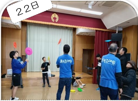
「安城市レクリエーション支援者クラブ」によるニュースポーツ体験