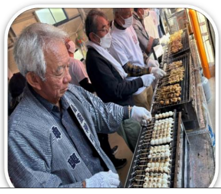
毎年恒例「福釜大人みこし会」による模擬店