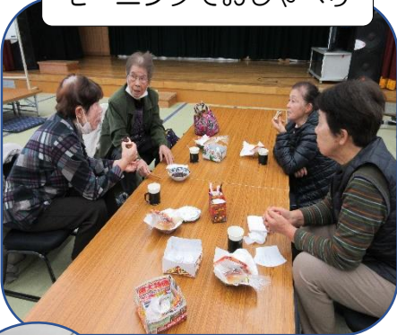
モーニングでおしゃべり