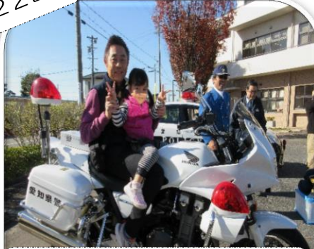
「安城警察署」の白バイ・パトカー乗車体験・鑑識体験