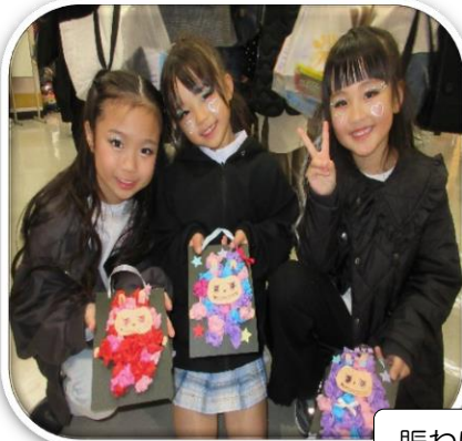
賑わいの中の笑顔