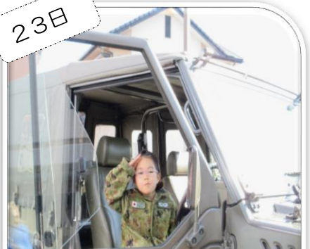
「自衛隊」の自衛隊パジェロ乗車体験・迷彩服試着