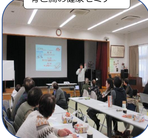
骨と腸の健康セミナー