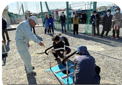
マンホールトイレ組み立て