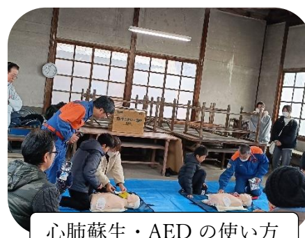
心肺蘇生・AED の使い方

12月14日（日）に榎前町で防災訓練【緊急集合訓練】が行われました。組ごとの連絡網を用いて電話を掛け、安否を確認したのち、町内会事務所に報告に行くという一連の流れを確認しました。その後、心肺蘇生やAEDの使い方を学び、災害への備えを進めていました。