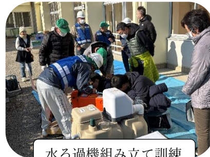
水ろ過機組み立て訓練

12月7日（日）に箕輪町で安否確認訓練、防災訓練が行われました。班ごとに安否確認を行い、避難場所である三河安城小学校までの避難を想定した訓練を行いました。小学校では実際にマンホールトイレを組み立てるなど、実践的な内容になっていました。