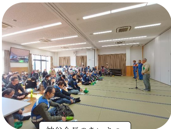
神谷会長のあいさつ