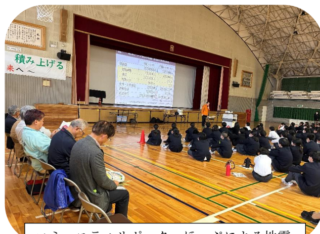
コミュニティサポーターほっぷによる地震災害に関する講話

当日は、各町内会長がそれぞれ自分の町の生徒に対して地域の取り組みの話をした後に、コミュニティサポーターほっぷの皆様から、地震災害や災害時のトイレについてお話されるなど、地域防災への理解を深めてもらう機会となりました。