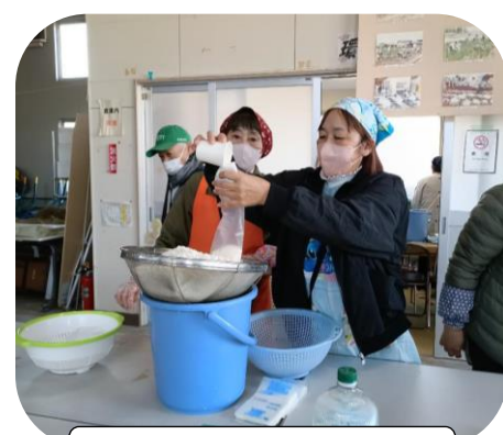
炊飯袋を使いお米を炊く

12月7日（日）に高棚町で防災訓練が行われました。当日は各組の班長と町内の役員、福祉委員会のメンバーなど合計110名が参加し、心肺蘇生法（AED）の使い方や、消火器訓練、防災機材の説明などを受けました。また、昨年からハソリを使った炊き出し訓練を再開しており、女性の福祉委員さんが中心になって、災害時に温かいご飯を食べられるように、災害用炊飯袋を用いて食事を提供する方法などを学びました。