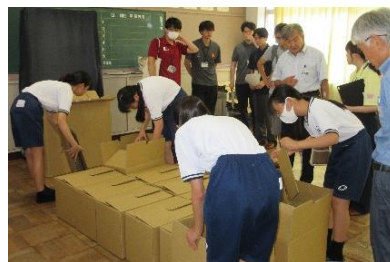
▲中学生防災教室の様子