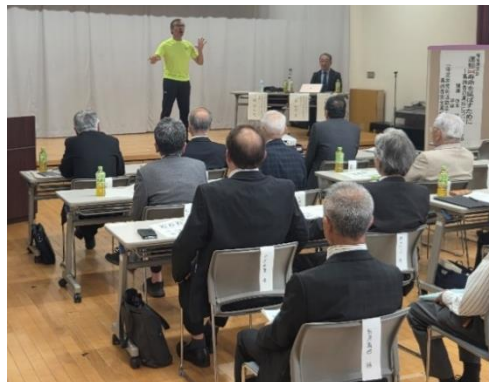
▲福祉講演会の様子