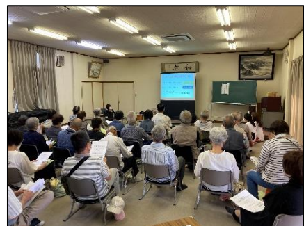
▲ハートフルケアセミナーの様子